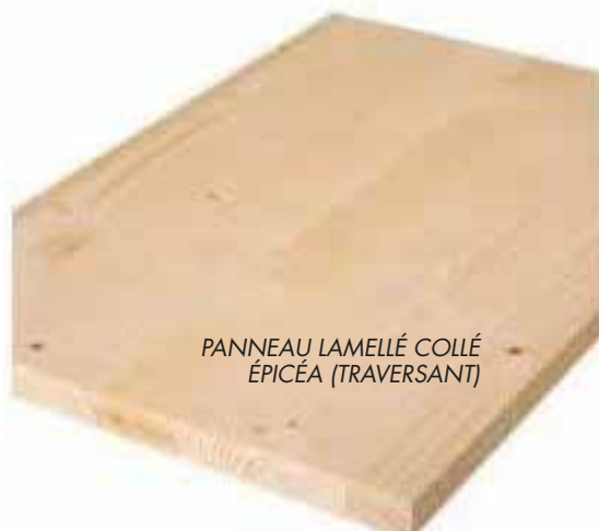
PANNEAU LAMELLÉ COLLÉ ÉPICÉA (TRAVERSANT)